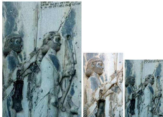
(الف) تصویر با وضوح آموزش با (ج) نتیجه نهایی در SNR=90dB (ب) تصویر با وضوح بالا (د) تصویر با وضوح بالا

نویسندگان در [۴] شیوه‌ای جدید برای افزایش وضوح یک تصویر با استفاده از یک تصویر آموزشی ارائه نموده بودند که در مقاله‌ی حاضر به رفع مشکلاتی از آن پرداخته شد. استفاده از یک روش ثبت تصویر مبتنی بر ناحیه به منظور دقیق‌تر شدن مدل نگاشت تصاویر و حذف مرزهای تصاویر با یک روش هم‌رنگ‌سازی بدون درز مرحله‌ی هستند که در کار قبلی انجام نشده بودند. نوآوری اصلی این مقاله لحاظ کردن معیار شباهت ساختاری دو تصویر در فرمولبندی شیوه‌ی معروف ثبت تصویر لوکاس-کاناد و استفاده از آن در وضوح برتر می‌باشد. نتایج پیاده‌سازی‌های انجام شده برتری شیوه‌ی ثبت تصویر پیشنهادی را در مقایسه با دو روش دیگر و همچنین کارایی آنرا در مسئله‌ی وضوح برتر در مقایسه با برخی از دیگر روشها نشان داده است.